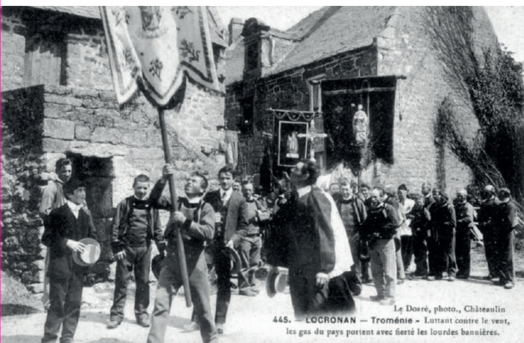
445. LOCRONAN — Troménie — Lannan contre le vent, les gens du pays portant avec dans les lourdes besacières.

La rue Lann était un lieu de logistique essentiel pour le commerce de Locronan. On imagine l'animation qui y régnait : le bruit des roues sur les pavés, les marchands qui négociaient, les charretiers qui attelaient leurs bœufs et leurs chevaux, prêts à prendre la route pour les ports d'exportation comme Pouldavid (aujourd'hui quartier de Douarnenez). Mais la rue Lann est également un véritable plateau artistique à ciel ouvert. C'est ici, au N°2, dans la maison familiale acquise par sa mère en 1912, qu'Yves Tanguy, peintre surréaliste, venait passer certains étés avec ses amis artistes : Jacques et Pierre Prévert, Max Jacob, Marcel Duhamel et Benjamin Péret.